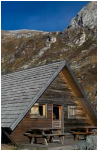
Le chalet-dortoir du refuge de Plaisance.