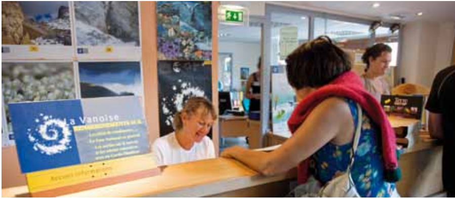
Hôtesse du Parc national de la Vanoise accueillant et renseignant les visiteurs à Termignon.