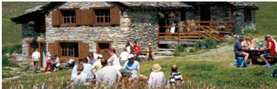
Refuge de Vallonbrun.