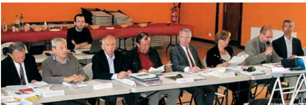
Le conseil d'administration débat de l'avant-projet de charte.