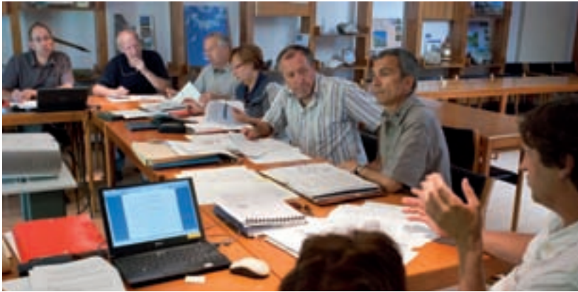
Bureau du conseil d'administration du Parc national de la Vanoise, le 9 juillet 2010.