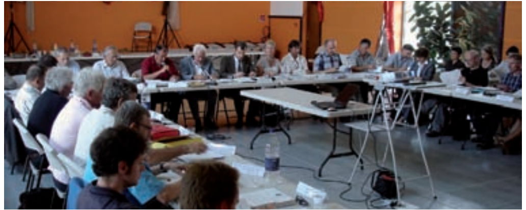
Conseil d'administration du Parc national de la Vanoise, le 12 juillet 2010.