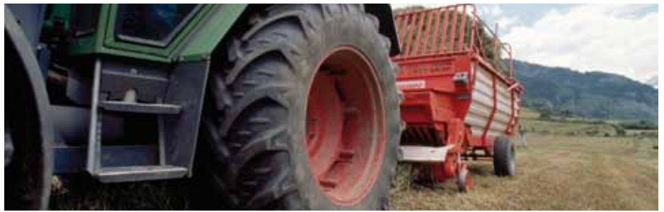
Ramassage du foin, Lanslebourg-Mont-Cenis