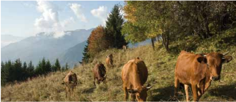
Vaches au pré près de Pelapoët. PLanay © PNV - Alexandre Garnier