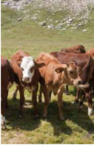
Veaux de races Tarentaise et Abondance. Plan de la Grassaz. Peisey-Nancroix