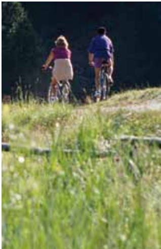
VTT près du lac du Tuéda. Les Allues.