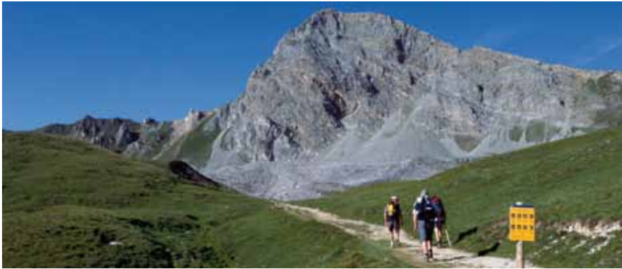
Randonneurs et panneau de réglementation du parc. Vue sur le roc Merlet.