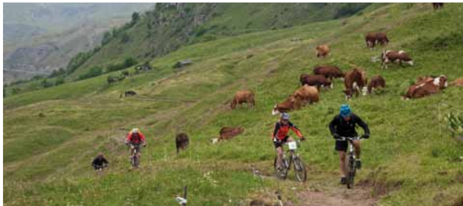
Vététistes à Saint-Martin-de-Belleville.