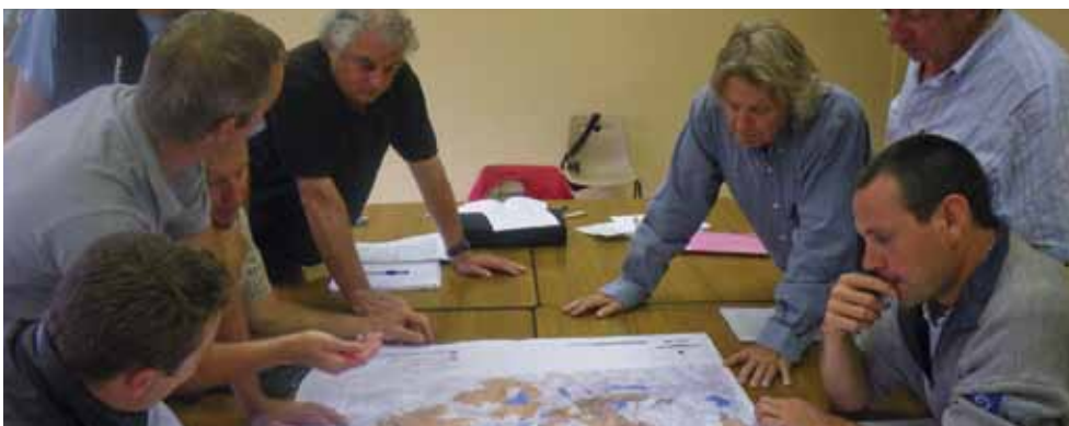
Groupe de travail sur le vol libre et le vol à voile, en réunion le 16 juin.