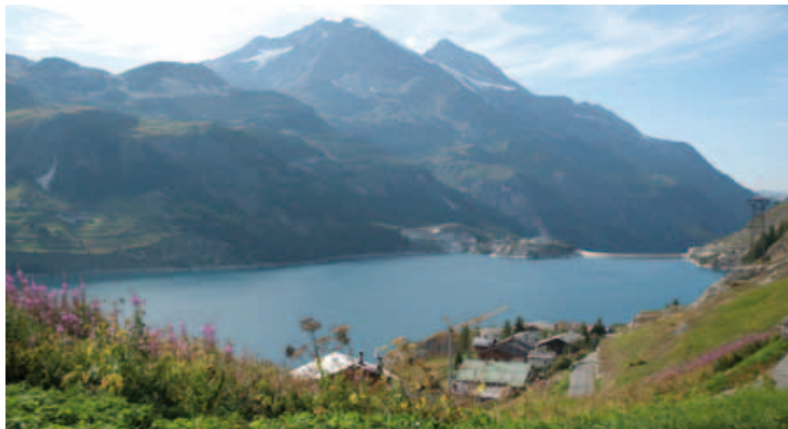
Le hameau du Villaret du Nial, dominant le Lac du Chevril

« Après l'inauguration du refuge de Rosuel où se rendent de nombreux visiteurs sans en chercher forcément la fonction de porte du Parc, nous souhaitons mettre en situation les promeneurs. Autour de ce bâtiment implanté dans un site exceptionnel, nous créons une scénographie accessible à tous dont les personnes handicapées. Deux parcours piétonniers relativement plats, de 500 m à 3 km pour celui permettant de s'approcher des cascades, des bouquetins, des marmottes et des chamois, intégreront les dimensions naturelle, touristique, paysagère et agricole du site. Des panneaux d'information sur les paysages, l'agriculture, la faune, la flore et la géologie permettront d'apprendre à lire la nature, inciteront à se ressourcer intelligemment. Les visiteurs seront appelés à prendre conscience et connaissance, à grandir dans le respect de l'environnement. Portée par la commune avec l'appui du Parc de la Vanoise et des services départementaux du tourisme, la constitution de ces promenades savoyardes s'étalera sur les 3 prochains étés pour une ouverture en 2013. »