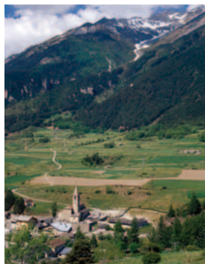
Vue sur le village de Termignon. En arrière-plan, la pointe de Bellecôte