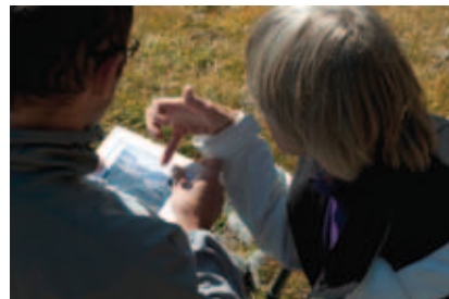
Reproduction d'une prise de vue de l'Observatoire photographique des paysages de Vanoise

« L'opération menée sur la ligne à Très Haute Tension sur le territoire de Lanslebourg-mont Cenis cet été a évidemment mobilisé toutes les attentions car une ligne de cet ordre dans notre paysage de montagne apporte une gêne visuelle. Néanmoins, le remplacement des câbles électriques pour augmenter les capacités évite toute construction supplémentaire. Cet important chantier s'est appuyé sur une concertation forte entre la commune, RTE, le Parc national de la Vanoise et le Conservatoire Botanique National de Gap-Charance. Objectif : réhabiliter une ancienne route militaire comme voie d'accès, au cœur même de l'espace de Malamot sous arrêté préfectoral de protection de biotope. Les espèces protégées ont ainsi été répertoriées et transplantées. La commune a également, avec l'appui du Parc, conclu avec RTE une convention triennale favorisant l'embauche 4 mois durant de deux animateurs d'été afin de sensibiliser touristes et populations au respect des mesures de protection. Leur mission passe aussi par l'explication du caractère endémique du Jardin Alpin. Une exposition, un film sur le biotope du Mont-Cenis et un vieux mur complètent ces efforts d'information. »